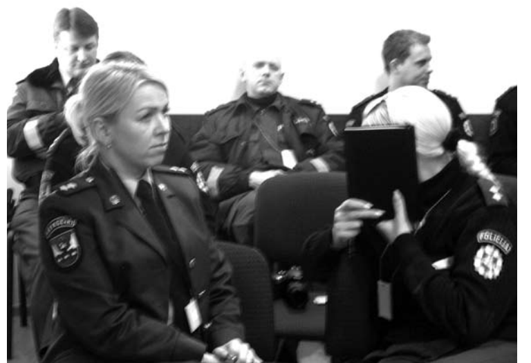
Vienas iš būdų atkreipti į save dėmesį - žaisti slėpynes.

Kita vertus, buvo toks senas rusiškas filmas „Baltoji dykumos saulė“, kur visos musulmonės moterys slėpė veidus, o rusas kareivėlis prie vienos iš jų lindo ir vis prašė: „Giulčita, parodyk veidelį“. Galbūt, jei būtų veidelis matomas, nebūtų ir lindęs... Paspalptis visuomet prikausto dėmesį, kelia susidomėjimą, įtampą... Gal ir policijos Giulčita turėjo tokį tikslą.