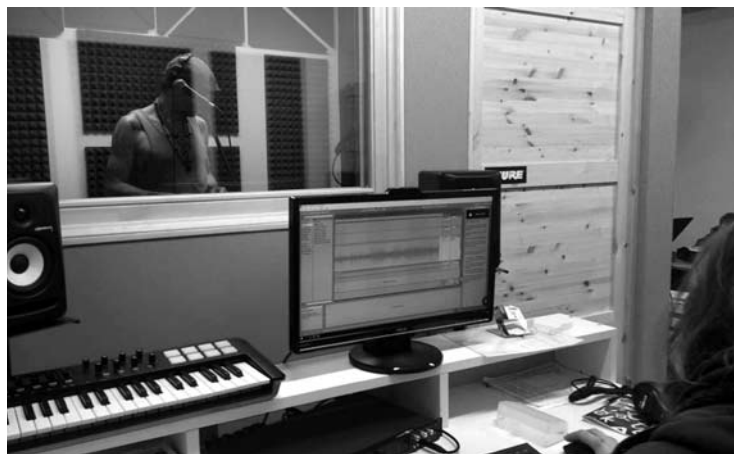
Šia garso įrašų studija visi norintieji gali pasinaudoti nemokamai.

Garso įrašų studija, pavadinta „Idėjų LABAS“, visų norinčiųjų laukia nuo antradienio iki ketvirtadienio. Jos darbo laikas – nuo 14 iki 18 valandos.