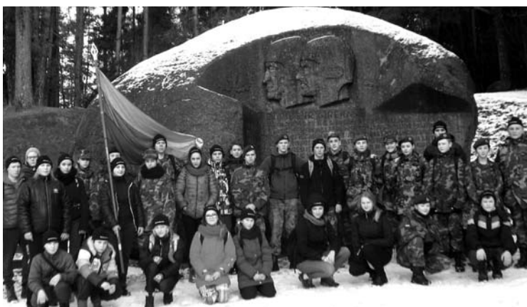
Prie Puntuko akmens žygio dalyviai prisiminė jo kunigaikštiskas legendas ir šventojo slėnio pasaką.