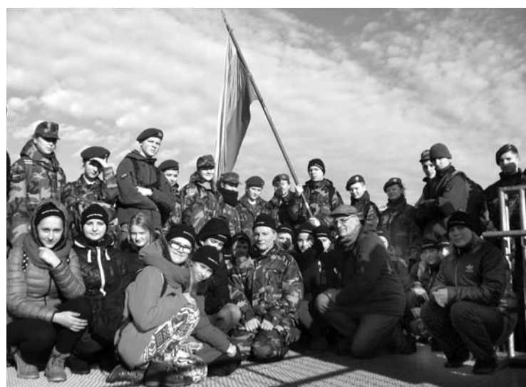
Vėjas išskleidė, suplazdeno trispalvę lajų tako bokštę.

pėsčiųjų taku patogiai keliavome. Priekyje laisvės spalvomis žydėjo trispalvė. Miško takeliais, tiltais, kalnus ir slėnius jungiančiais laiptais, nuo jaunatviškos spartos net sukaitę, rausvais veidais ir šypsenomis paženklininti įveikėme ištvinusį upelį, baltu švarumu spindinčius sniegynus ir, įkopę į gal stačiausią pašvenčio kalną, pasiekėme Šventųjų ažuolų slėnį.