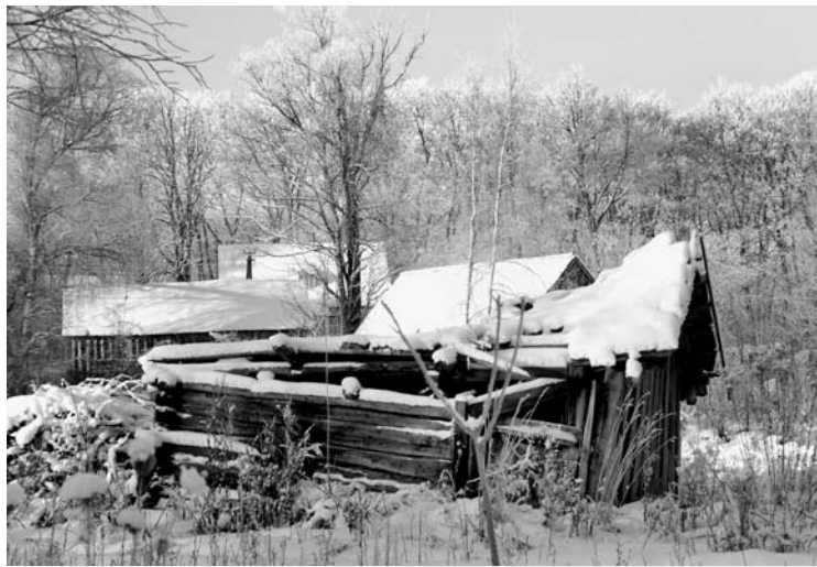
Žiemą kaimas stovi tuščias ir liūdnas, atgyja tik vasaromis.