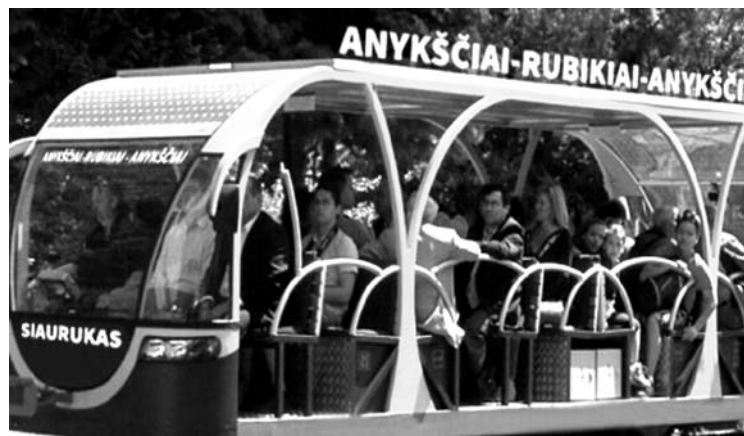
Toks saulės energija varomas traukinys šią ar kitą vasarą turėtų važinėti tarp Anykščių ir Rubikių.

Tikėtina, kad dar šiemet ar kitamet iš Anykščių į Rubikius kursuos elektrinis traukinys. Tai būtų pats moderniausias, ekologiškiausias saulės energija varomas siaurojo geležinkelio traukinys, vienas iš nedaugelio pasaulyje.