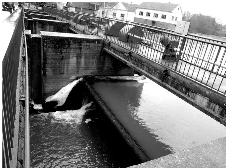
Šventosios užtvanka – sudėtingas hidrotechninis įrenginys.