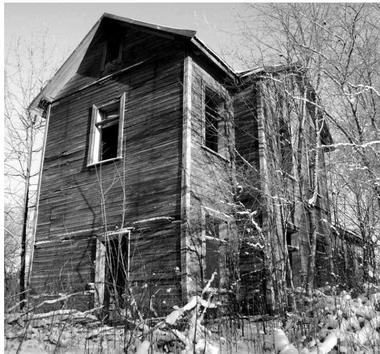
Iki šių dienų išlikusi dviaukštė geležinkelio stotis slepiasi krūmynuose ir jau beveik nebėr žymių buvusio perono, geležinkelio sankasos. Bešeimininkiu turtu tapusi stotis, matyt, tiktų nebent malkoms...