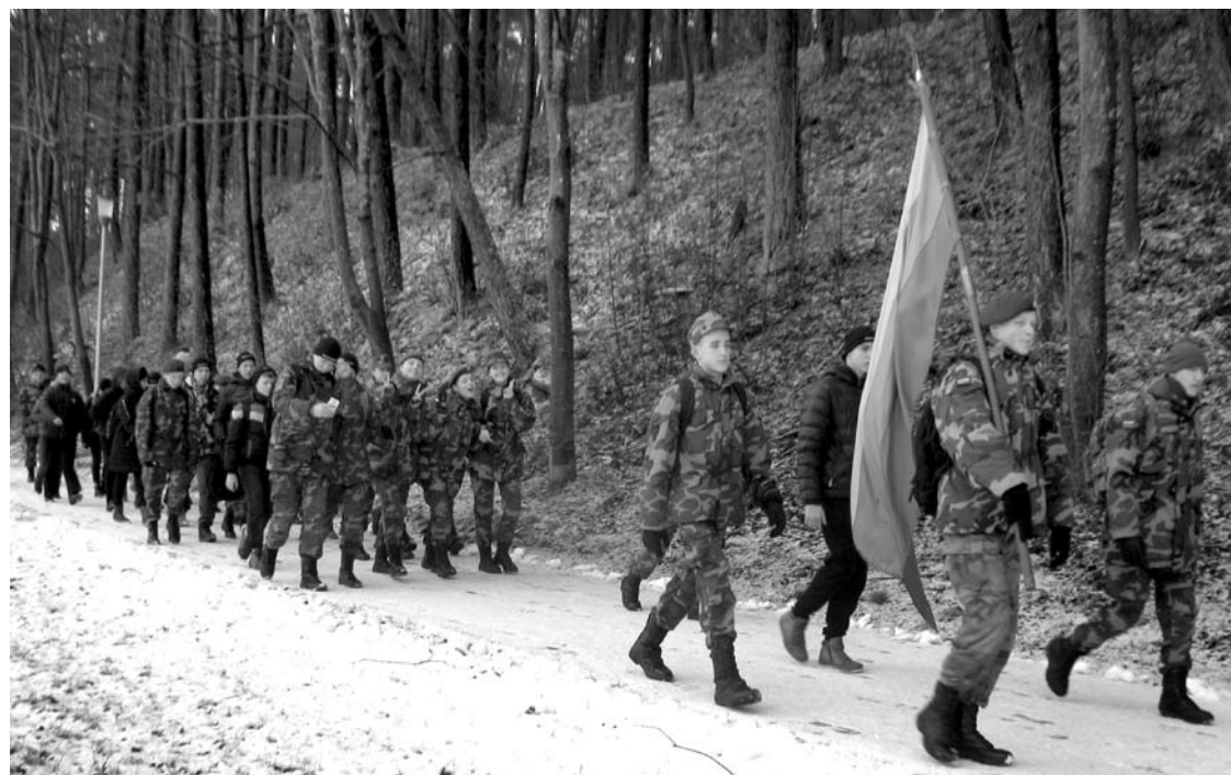
Dariaus ir Girėno šaulių kuopos jaunieji šauliai žygyje.

Tradiciskai, paminint 1945 m. vasario 16-ąją Storių kalno bokšte trispalvę iškėlusią Lietuvos partizanų žygį, kasmet su Anykščių moksleiviais, gimnazistais bei jaunaisiais šauliais einame į pagarbios atminties žygį.