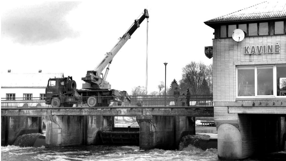
Remontinį skydą įstatyti ir ištraukti prireikė krano iš Utenos.

Užtvanką išsinuomojusi UAB „Sontesa“ užtvankoje ruošiasi statyti turbinas ir modernizuoti užtvanką, kurios įrenginiai yra dar tarybinių laikų, susidėvėję, tad gedimų gali pasitaikyti ir ateityje.